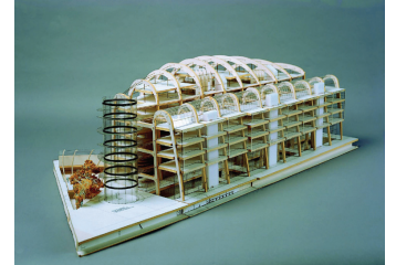
© NICHOLAS GRIMSHAW & PARTNERS LTD.

ALTE JAKOBSTRASSE 124 – 128 10969 BERLIN WWW.BERLINISCHEGALERIE.DE TEL. +49 (0)30 78 90 26 00 MI – MO 10 – 18 UHR